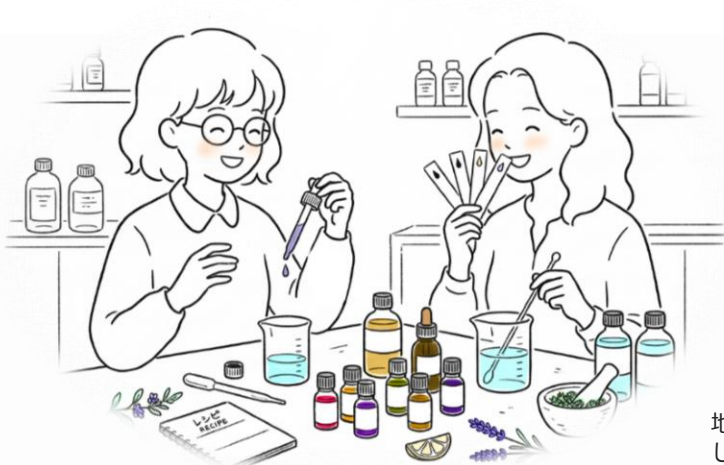
南会津の和製油を使ったお好みのアロマスプレー作成