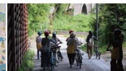
たいらまちなかフォトウォーク