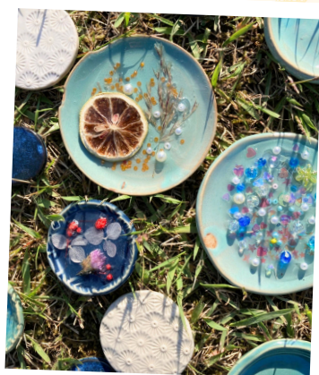
会津本郷焼×レジン ワークショップ