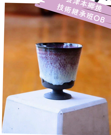
鳩羅那陶 (クラナポッターリー) 陶磁器&獣ガチャの販売