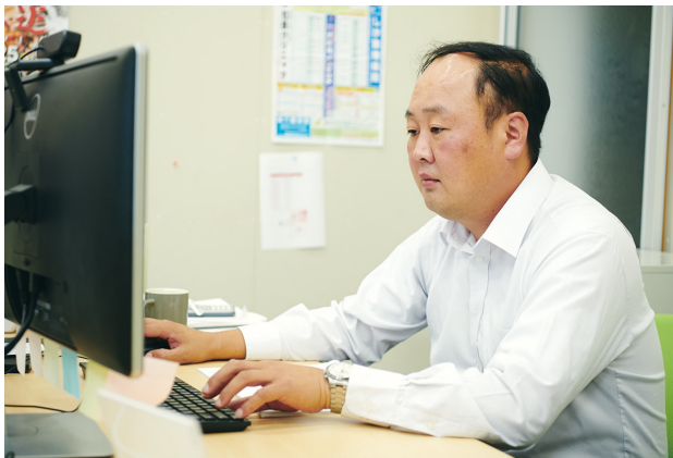
設計からプロジェクト管理、営業まで広く行う