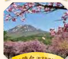
天鏡台 (町営牧場を含む)